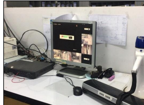
ภาพที่ 42 กล้อง CCTV / ห้องควบคุมกล้อง CCTV