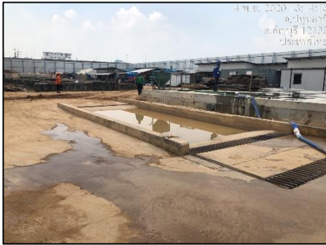
ภาพที่ 39 จุดล้างล้อ