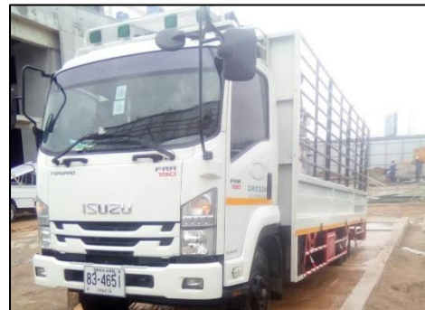
ภาพที่ 41 ป้ายสะท้อนแสงข้างรถขนส่ง