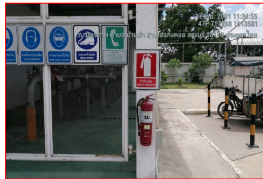
อุปกรณ์ดับเพลิง

ภาพที่ 3.2-1 ภาพถ่ายระบบรักษาความปลอดภัยบริเวณสถานีก๊าซโครงการท่อส่งก๊าซธรรมชาติ ไปยังสถานีบริการ NGV ของสมาคมขนส่งทางบกแห่งประเทศไทย พื้นที่ อ.แก่งคอย จ.สระบุรี