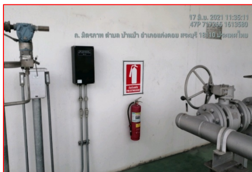
อุปกรณ์ดับเพลิง