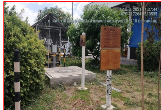
ป้ายเตือนแนวท่อส่งก๊าซฯ