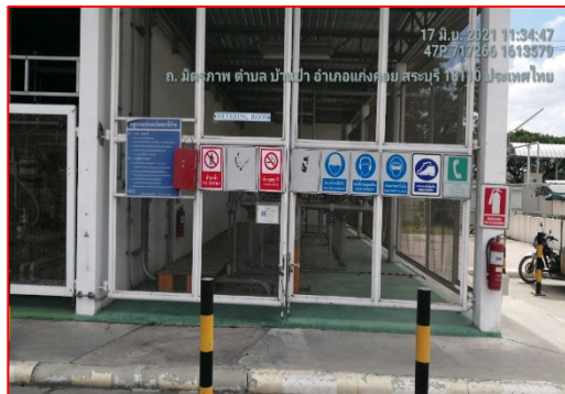
ป้ายเตือนความปลอดภัย