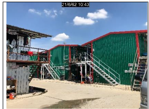
รูปที่ ฐ-78 จัดให้มีห้องสุขาให้เพียงพอสำหรับ จำนวนคนงาน