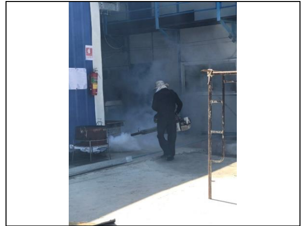
รูปที่ ฐ-80 ฉีดพ่นยากำจัดแหล่งเพาะพันธุ์ยุง โดยองค์การบริหารส่วนตำบล และสถานีอนามัย