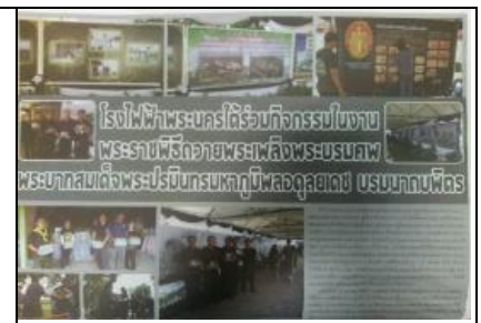
รูปที่ ฐ-45 ฐ-46 และ ฐ-47 เผยแพร่ข้อมูลโครงการฯ และโรงไฟฟ้าพระนครใต้ ผ่านหนังสือพิมพ์ท้องถิ่น