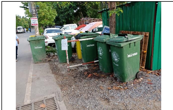
รูปที่ ฐ-75 จัดวางภาชนะรองรับขยะมูลฝอย โดย จ้างองค์การบริหารส่วนตำบลบางโปรงนำไปกำจัด