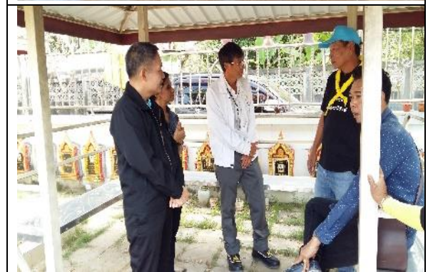
รูปที่ ฐ-61 – ฐ-66 ลงพื้นที่พบปะ พูดคุยกับชุมชน เพื่อรับฟังความคิดเห็นเกี่ยวกับผลกระทบจากการ ดำเนินงานของโครงการฯ พร้อมกับตรวจสอบบ้านของชุมชนที่ได้รับผลกระทบจากการขนส่ง