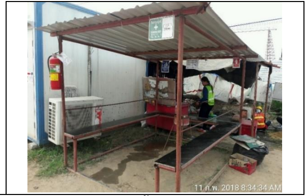
รูปที่ ฐ-43 และ ฐ-44 จัดทำที่พักชั่วคราวสำหรับผู้ปฏิบัติงานในพื้นที่ก่อสร้าง