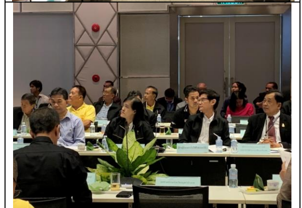
รูปที่ ฐ-67 – ฐ-70 จัดประชุมคณะกรรมการร่วมติดตามตรวจสอบการดำเนินงานด้านสิ่งแวดล้อมและการพัฒนาคุณภาพชีวิตชุมชนโรงไฟฟ้าพระนครใต้ ครั้งที่ 2 ประจำปี 2562 ณ โรงไฟฟ้าพระนครใต้