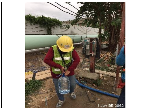
รูปที่ ฐ-71 จัดให้มีน้ำดื่มสะอาดสำหรับคนงานก่อสร้าง