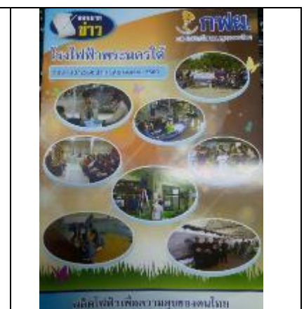
รูปที่ ฐ-50 ฐ-51 และ ฐ-52 จัดทำจดหมายข่าวโรงไฟฟ้าพระนครใต้รายเดือนแจกจ่ายให้ชุมชนโดยรอบ