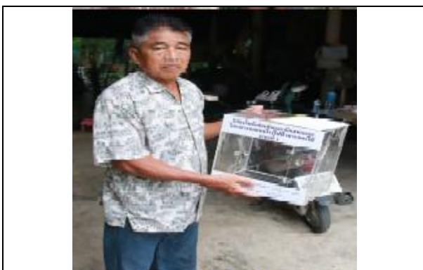
รูปที่ ฐ-89 โรงไฟฟ้าพระนครใต้ส่งมอบกล่อง รับ ความคิดเห็นและข้อเสนอแนะจากชุมชน จำนวน 6 จุด