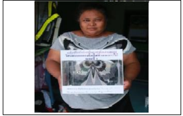
รูปที่ ฐ-86 โรงไฟฟ้าพระนครใต้ส่งมอบกล่อง รับความคิดเห็นและข้อเสนอแนะจากชุมชน จำนวน 6 จุด