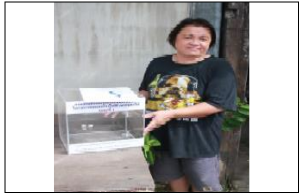
รูปที่ ฐ-88 โรงไฟฟ้าพระนครใต้ส่งมอบกล่อง รับความคิดเห็นและข้อเสนอแนะจากชุมชน จำนวน 6 จุด