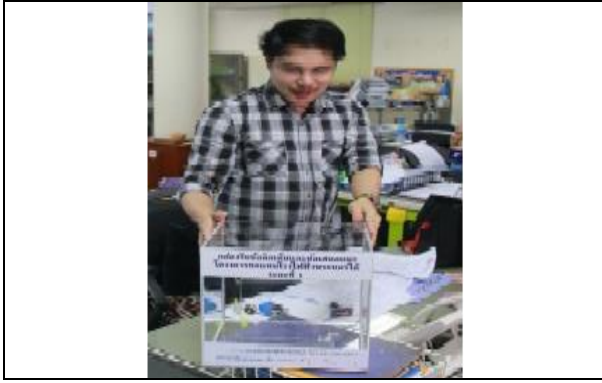
รูปที่ ฐ-85 โรงไฟฟ้าพระนครใต้ส่งมอบกล่อง รับ ความคิดเห็นและข้อเสนอแนะจากชุมชน จำนวน 6 จุด