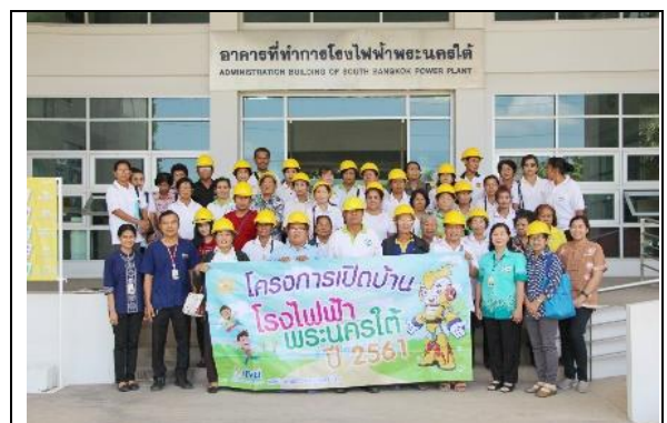
รูปที่ ฐ-57 และ ฐ-58 โครงการเปิดบ้านโรงไฟฟ้าพระนครใต้ ให้กับหน่วยงานราชการในจังหวัด สมุทรปราการ เยี่ยมชมและรับฟังการบรรยายภารกิจของ กฟผ. โรงไฟฟ้าพระนครใต้ และ ความก้าวหน้าโครงการฯ