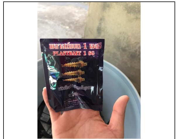
รูปที่ ฐ-81 และ ฐ-82 ใส่ผลิตภัณฑ์ (พลาสติกเบต) ลงในแหล่งน้ำเพื่อกำจัดลูกน้ำยุงลาย