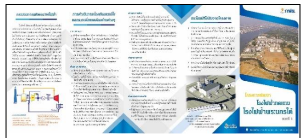
รูปที่ ฐ-48 และ ฐ-49 จัดทำสื่อแผ่นพับข้อมูลโครงการ SBRP1 เพื่อแจกจ่ายประชาสัมพันธ์ข้อมูลเกี่ยวกับโครงการฯ