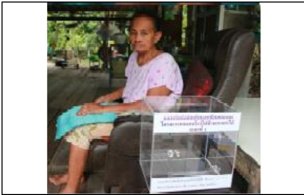
รูปที่ ฐ-87 โรงไฟฟ้าพระนครใต้ส่งมอบกล่อง รับ ความคิดเห็นและข้อเสนอแนะจากชุมชน จำนวน 6 จุด