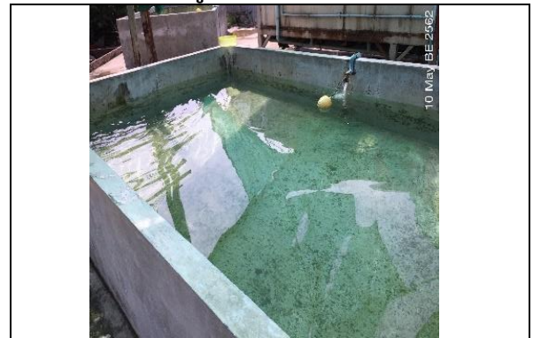
รูปที่ ฐ-76 จัดทำบ่อพักน้ำทิ้งเพื่อให้ตกตะกอน