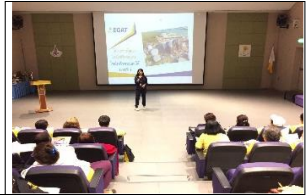
รูปที่ ฐ-59 และ ฐ-60 จัดกิจกรรมศึกษาดูงานเชิงประจักษ์ ณ เขื่อนศรีนครินทร์ จ.กาญจนบุรี