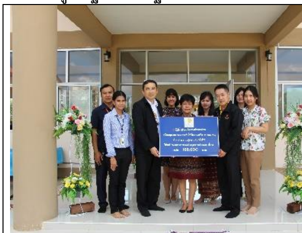
รูปที่ ฐ-83 สนับสนุนงบประมาณด้านสาธารณสุข และสุขภาพชุมชน