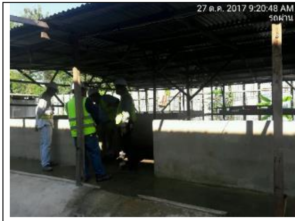
รูปที่ ฐ-79 จัดสร้างสถานที่อาบน้ำสำหรับคนงาน