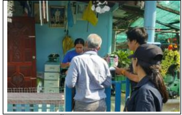
รูปที่ ฐ-54 ลงพื้นที่เพื่อแจ้งการตอกเสาเข็ม และ ส่งหนังสือให้ผู้ว่าราชการท้องถิ่นเพื่อ ประชาสัมพันธ์เสียงตามสายให้ชุมชนรับทราบ