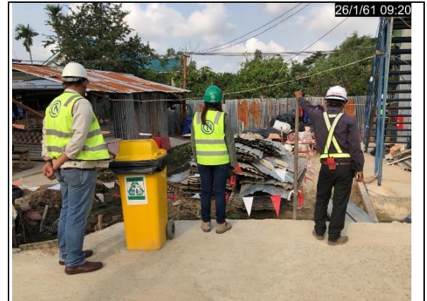
รูปที่ ฐ-74 ตรวจสอบสภาพแวดล้อมแคมป์ที่พัก คนงานทุกสัปดาห์ ความสะอาดห้องสุขา การ กำจัดขยะมูลฝอย การกำจัดแหล่งเพาะพันธุ์ยุง หนู และแมลงสาบ