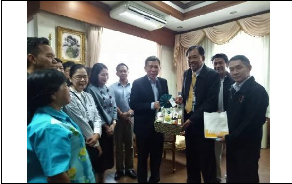
รูปที่ ฐ-55 เข้าพบผู้ว่าราชการจังหวัด สมุทรปราการ เพื่อรายงานความก้าวหน้า โครงการฯ