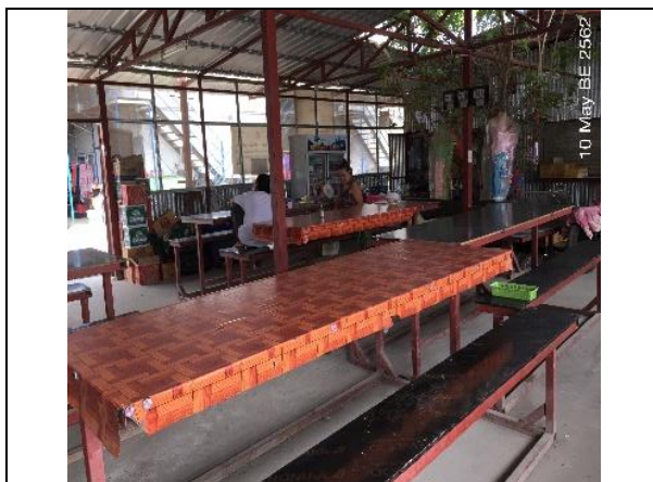
รูปที่ ฐ-77 จัดทำที่ปรุงอาหารสำหรับคนงาน บริเวณภายในแคมป์โดยไม่อนุญาตให้ทำอาหาร ภายในห้องพัก เพื่อป้องกันเหตุเพลิงไหม้