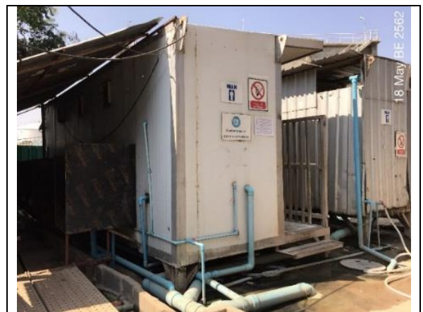
รูปที่ ฐ-72 จัดสร้างห้องสุขา ที่ถูกหลักสุขาภิบาลเพียงพอกับจำนวนคนงาน