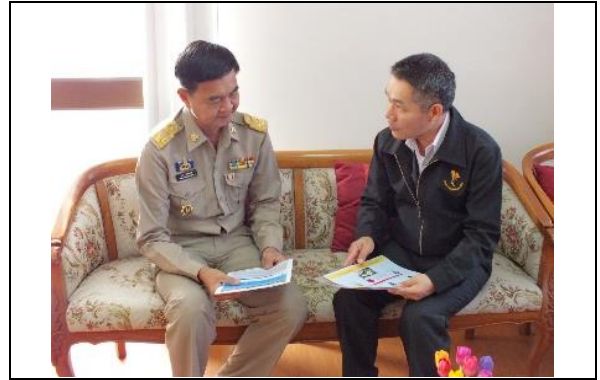
รูปที่ ฐ-56 เข้าพบนายอำเภอ จ.สมุทรปราการ เพื่อให้ข้อมูลความก้าวหน้าของโครงการฯ