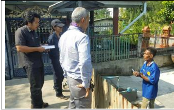
รูปที่ ฐ-53 ลงพื้นที่เพื่อแจ้งการตอกเสาเข็ม และ ส่งหนังสือให้ผู้ว่าราชการท้องถิ่นเพื่อ ประชาสัมพันธ์เสียงตามสายให้ชุมชนรับทราบ