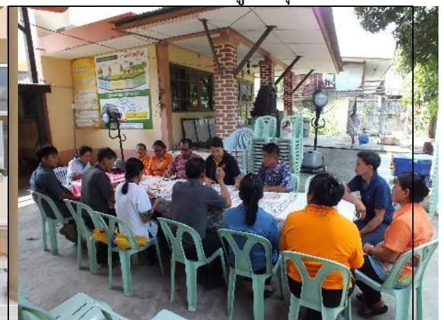
รูปที่ ฐ-84 ผู้บริหารโครงการฯ พบปะพูดคุย พร้อมแจ้งความก้าวหน้าของโครงการฯ ให้กับ ชุมชนได้รับทราบ เพื่อเสริมสร้างความสัมพันธ์ ระหว่าง กฟผ. กับหน่วยงานราชการและชุมชน รอบพื้นที่โครงการฯ