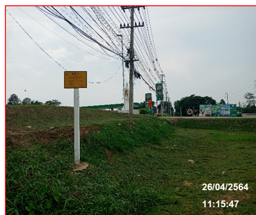
ป้ายเตือนแนวท่อส่งก๊าซฯ