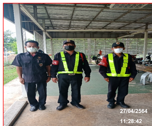
อุปกรณ์และเจ้าหน้าที่รักษาความปลอดภัย

ภาพที่ 3.2-1 ภาพแสดงป้ายเตือนตามแนวท่อของระบบท่อส่งก๊าซธรรมชาติและสถานีควบคุมความดัน และวัดปริมาตรก๊าซธรรมชาติของโครงการวางท่อส่งก๊าซธรรมชาติไปยังสถานีบริการ NGV ของสมาคมขนส่งทางบกแห่งประเทศไทย พื้นที่ อ.น้ำพอง จ.ขอนแก่น