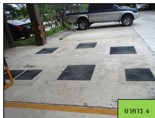
รูปที่ 1-6 ระบบบำบัดน้ำเสีย