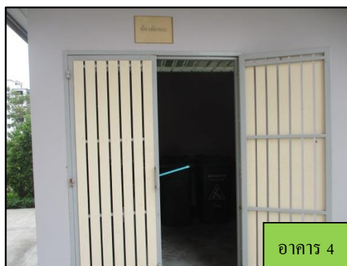
รูปที่ 1-7 ถึงขยะมูลฝอยภายในโครงการ