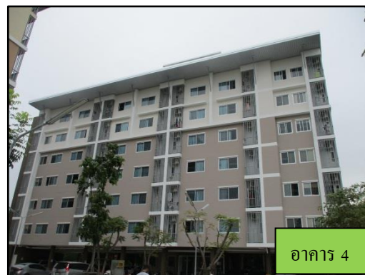
รูปที่ 1-3 ตัวอาคาร