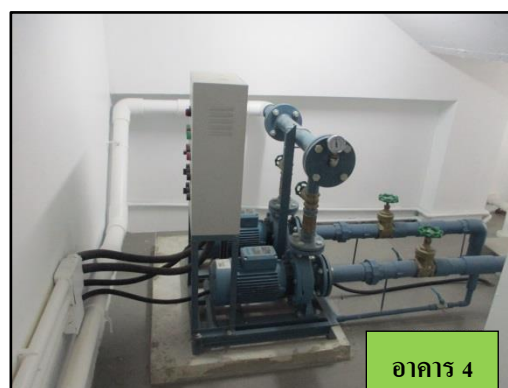
รูปที่ 1-5 ปัมป์ดึงเก็บน้ำขึ้นใต้ดิน