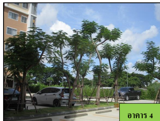
รูปที่ 1-8 พื้นที่สีเขียว