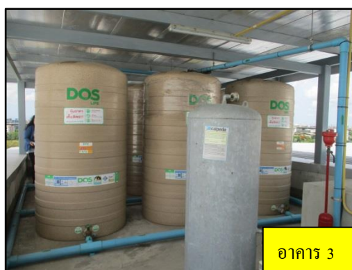
รูปที่ 1-4 ถังเก็บน้ำชั้นดาดฟ้า