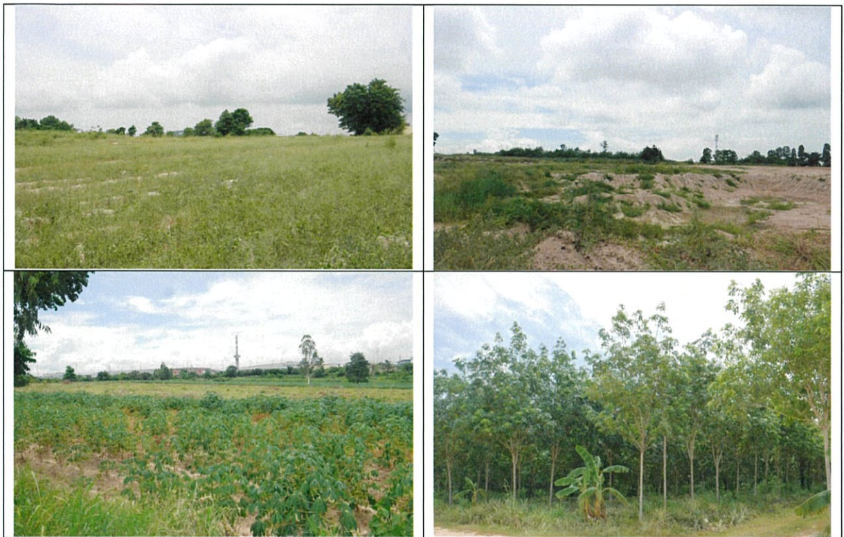
ยังไม่ปรับถมที่