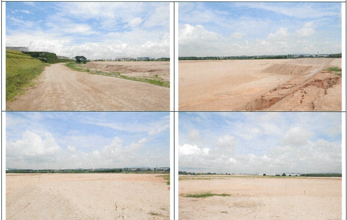
ปรับถมที่แล้ว

สภาพพื้นที่ปัจจุบันของโครงการนิคมอุตสาหกรรมอมตะซิตี้ ระยอง (ส่วนขยาย) ระยะที่ 6 ของบริษัท อมตะซิตี้ ระยอง จำกัด