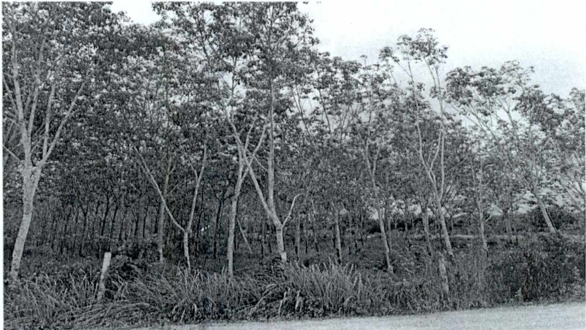
ภาพประกอบที่ ๑ แสดงพื้นที่สวนยางพาราบริเวณทางทิศตะวันออกบริเวณทางเข้าพื้นที่ประทานบัตร

ภาพถ่ายประกอบการตรวจสอบการขอเปลี่ยนแปลงเวลาการระเบิดตามมาตรการป้องกันและแก้ไขผลกระทบสิ่งแวดล้อม สำหรับประทานบัตรที่ ๒๗๖๖๔/๑๕๙๔๙ ของบริษัท เขาแดงคอนสตรัคชั่น จำกัด (บริษัท เพชรภูผาเพิ่มทรัพย์ จำกัด รับช่วงฯ) ที่ตำบลปาดังเบซาร์ อำเภอสะเดา จังหวัดสงขลา เมื่อวันที่ ๑๗ พฤศจิกายน ๒๕๖๔