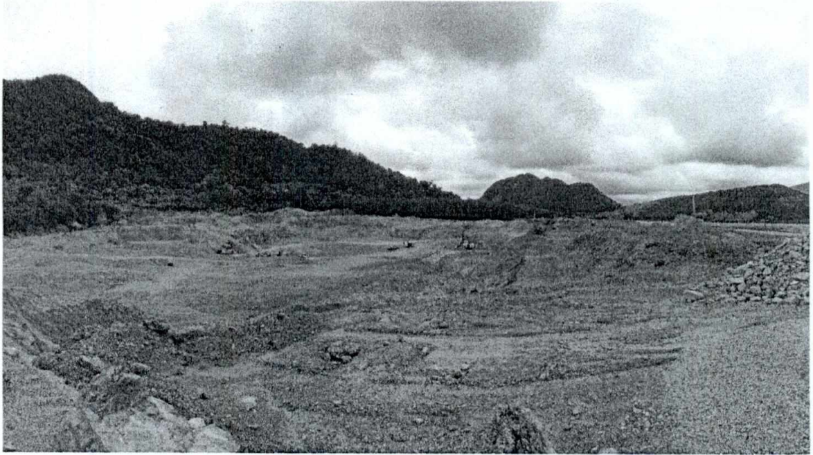
ภาพประกอบที่ ๓ แสดงพื้นที่การทำเหมืองมองไปตอนกลางทางทิศใต้ของพื้นที่ประทานบัตร