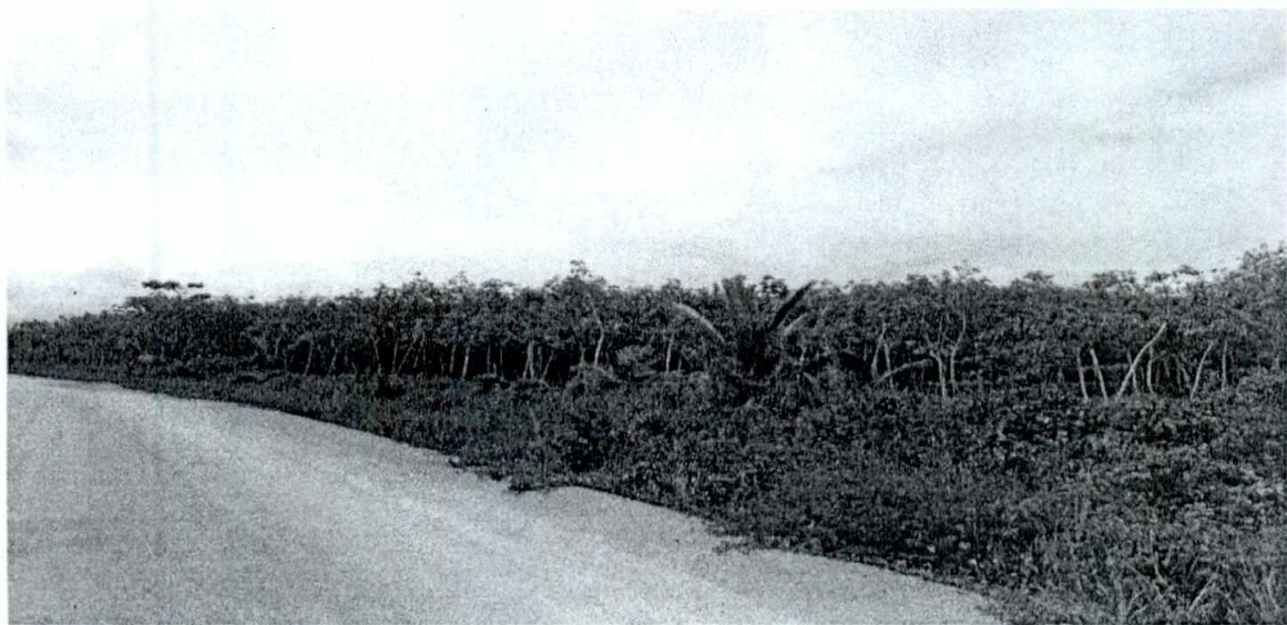
ภาพประกอบที่ ๒ แสดงพื้นที่สวนยางพาราบริเวณถนนทาง เข้า-ออก บริเวณทางเข้าพื้นที่โครงการ

พรชวุฒิ (นายพรชวุฒิ พรหมทองบุญ) วิศวกรเหมืองแร่ปฏิบัติการ