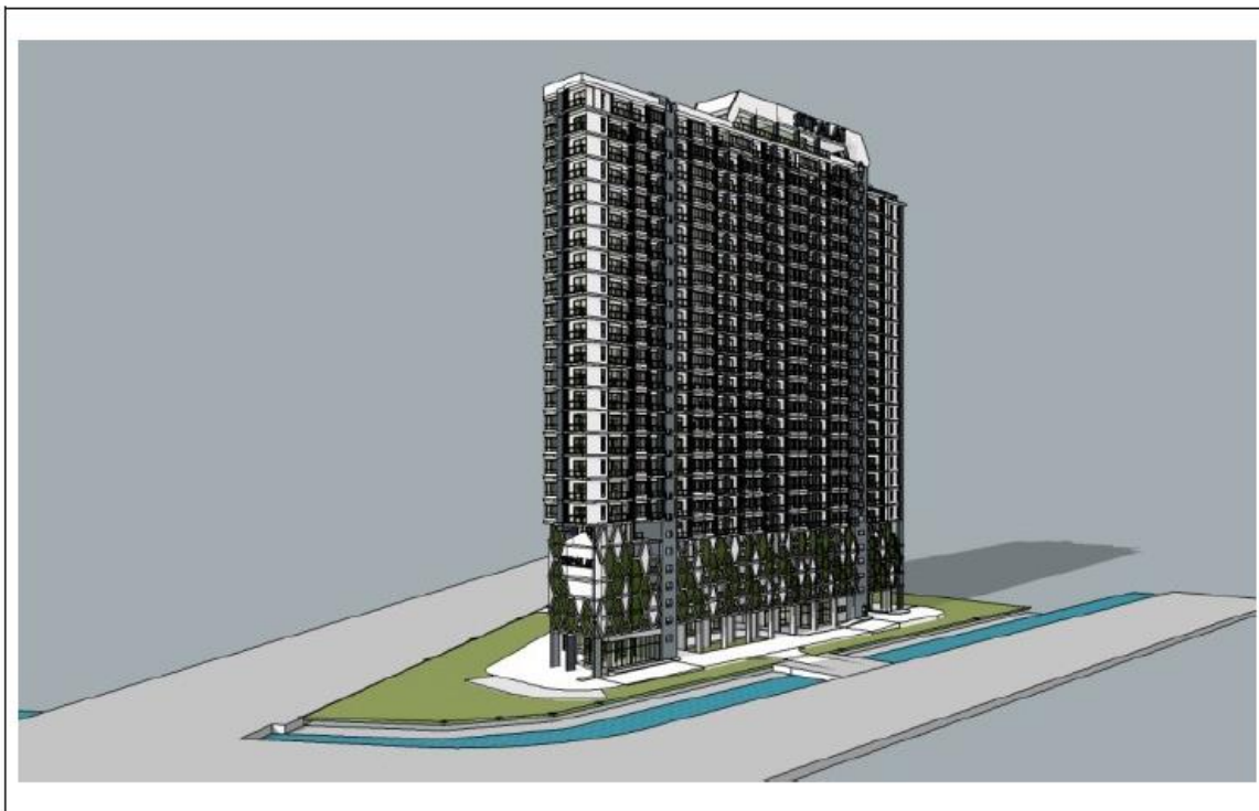
รูปที่ 2.3-1 แบบจำลองอาคารของ โครงการศูนย์การค้า พรีเมียร์ เจริญนคร

การพัฒนาโครงการบนพื้นที่ขนาด 5-1-0.7 ไร่ หรือ 8,402.8 ตร.ม. โดยก่อสร้างอาคารพักอาศัยรวม (อาคารชุด) มีลักษณะเป็นอาคารคอนกรีตเสริมเหล็ก สูง 26 ชั้น จำนวน 1 อาคาร มีห้องชุดพักอาศัย 578 ห้อง และห้องชุดเพื่อการพาณิชย์ (ร้านค้า) จำนวน 6 ห้อง รวมมีจำนวนห้องชุดทั้งสิ้น 584 ห้อง โดยมีพื้นที่อาคารรวมเท่ากับ 50,286 ตร.ม.