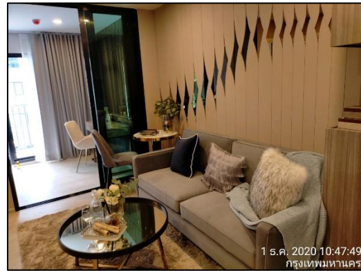
ภาพที่ 1.6-1 สถานภาพการก่อสร้างโครงการในปัจจุบัน