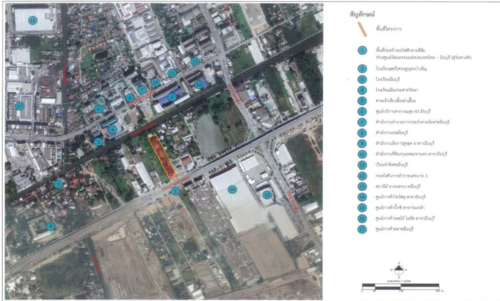
รูปที่ 2.1-3 ผังแสดงสภาพแวดล้อมบริเวณพื้นที่โครงการในมาตราส่วน 1 : 4,000