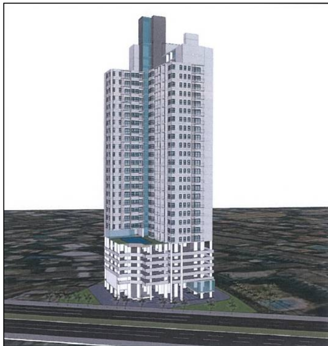
รูปที่ 2.5-1 แบบจำลองอาคารโครงการ

โครงการ สุภาลัย ลอฟท์ ประชาธิปก-วงเวียนใหญ่ อาคารของโครงการมีลักษณะเป็นอาคารคอนกรีตเสริม เหล็ก จำนวน 1 อาคาร คือ อาคารชุดพักอาศัยสูง 30 ชั้น มีห้องชุดพักอาศัย 363 ห้อง ห้องชุดเพื่อการพาณิชย์ (ร้านค้า) 2 ห้อง และที่จอดรถยนต์ 208 คัน แสดงแบบจำลองอาคาร โครงการดังรูปที่ 2.5-1 และการใช้ประโยชน์ พื้นที่แต่ละชั้นดังตารางที่ 2.5-1