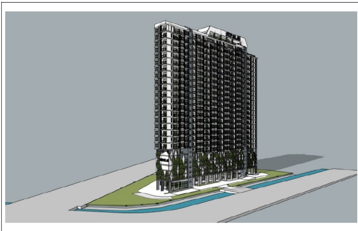
รูปที่ 2.3-1 แบบจำลองอาคารของโครงการสุภาลัย พรีเมียร์ เจริญนคร

การพัฒนาโครงการบนพื้นที่ที่จะขออนุญาตก่อสร้างเท่ากับ 5-1-0.7 ไร่ หรือ 8,402.8 ตร.ม. โดยก่อสร้างอาคารพักอาศัยรวม (อาคารชุด) มีลักษณะเป็นอาคารคอนกรีตเสริมเหล็ก สูง 26 ชั้น จำนวน 1 อาคาร มีห้องชุดพักอาศัย 578 ห้อง และห้องชุดเพื่อการพาณิชย์ (ร้านค้า) จำนวน 6 ห้อง รวมมีจำนวนห้องชุดทั้งสิ้น 584 ห้อง โดยมีพื้นที่อาคารรวมเท่ากับ 50,286 ตร.ม.