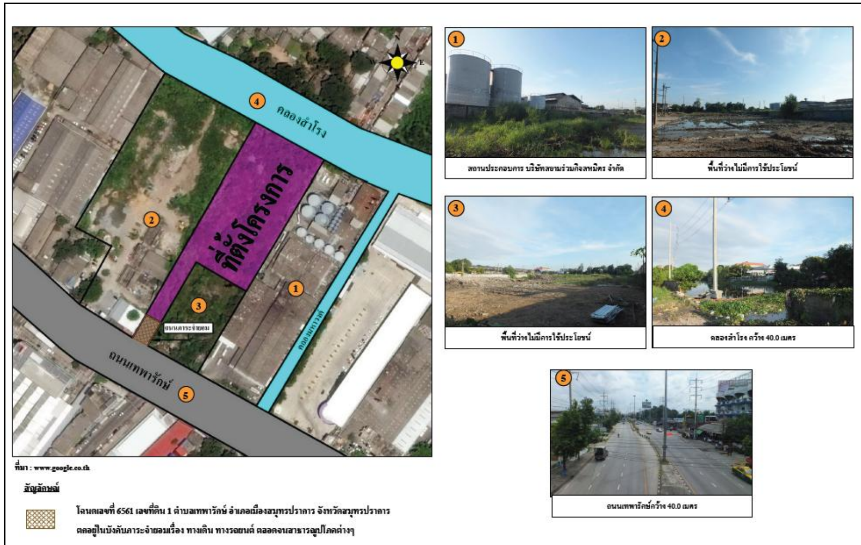
รูปที่ 2.1-1 แสดงสภาพการใช้ประโยชน์ที่ดินในปัจจุบันรอบโครงการ