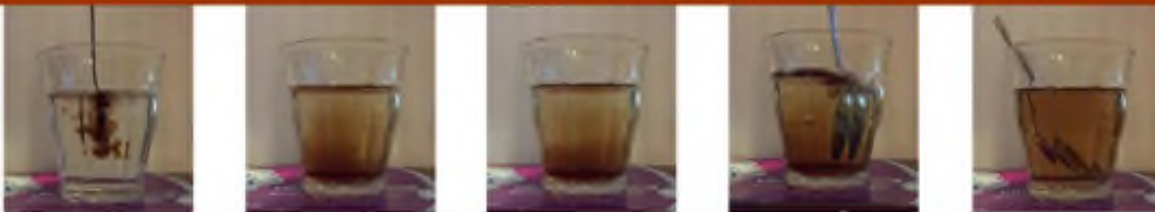
ที่มา: Gustin, J.L., "How the Study of Accident Case Histories Can Prevent Runaway Reaction Accidents to Occur Again." IChemE Symposium Series No. 1411, pp. 27-41, 2001.

เพื่อความปลอดภัย ดูแลเพื่อให้มีการกวนผสมเกิดขึ้นในถังเกิดปฏิกิริยา!