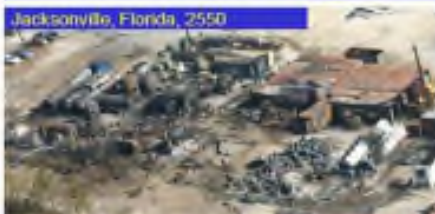
Jacksonville, Florida, 2550

ความเสียหายจากปฏิกิริยาอื่นที่ ควบคุมไม่ได้