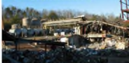
Morganton, North Carolina, 2549

อ้างอิง: Partington and Waldrem, IChemE Symposium Series, No. 148, pp. 61-93, 2001.