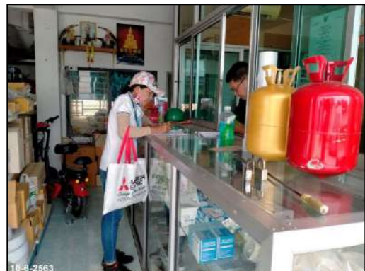
รูปที่ 3.1-1 ประมวลภาพกิจกรรมการสำรวจสภาพเศรษฐกิจ-สังคม และความคิดเห็นของประชาชน ในพื้นที่ศึกษาระหว่างวันที่ 10 มิถุนายน 2563