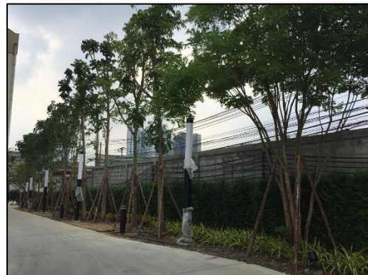
ภาพที่ 1.6-1 สถานภาพการก่อสร้างโครงการในปัจจุบัน