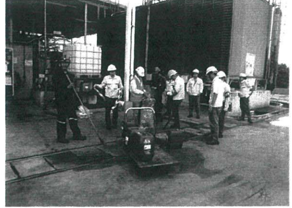
สวมใส่อุปกรณ์ป้องกันส่วนบุคคล