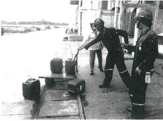
ผู้พบเห็นเหตุการณ์แจ้งหัวหน้างาน