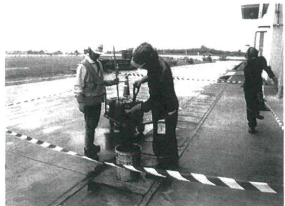
เมื่อดูดซับเสร็จแล้ว นำไปใส่ภาชนะที่เตรียมไว้เพื่อนำไปกำจัด