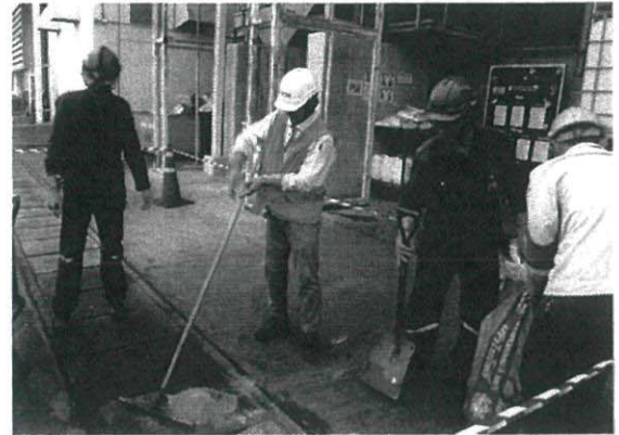
จัดเตรียมวัสดุสำหรับดูดซับสารเคมี