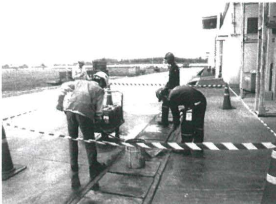
นำวัสดุดูดซับ มาระงับการรั่วไหลของสารเคมี