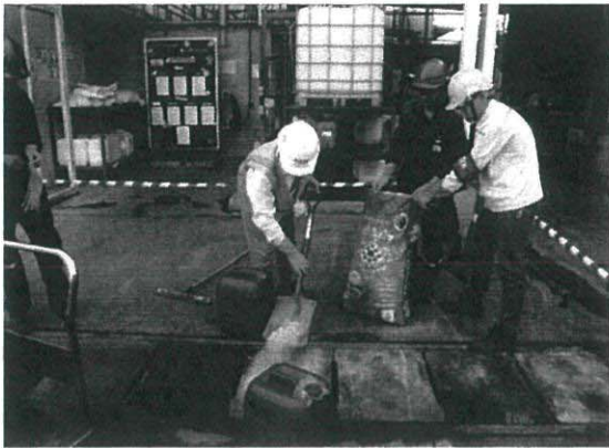
ทำการกั้นพื้นที่เพื่อไม่ให้ผู้ที่ไม่มีส่วนเกี่ยวข้องเข้าไป