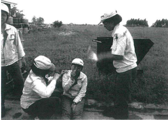
ทีมช่วยเหลือ ทำการปฐมพยาบาลผู้ป่วย