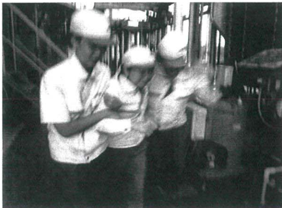
นำผู้ป่วยพบแพทย์ทันที