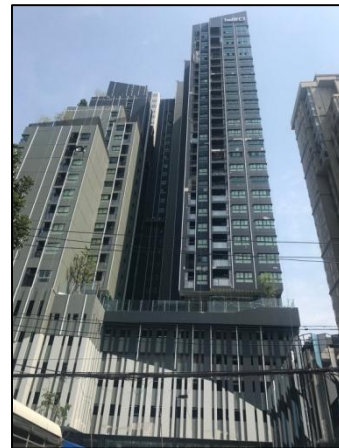
ภาพที่ 1.6-1 สถานภาพการก่อสร้างโครงการในปัจจุบัน