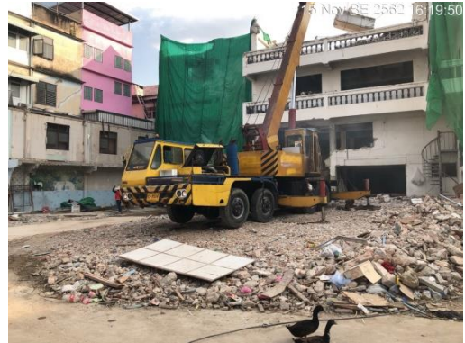
รูปที่ 1 สภาพหน้างานปัจจุบัน