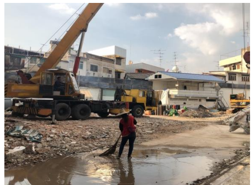
รูปที่ 3 คนงานก่อสร้างทำความสะอาดและฉีดพรมน้ำบริเวณพื้นที่โครงการ