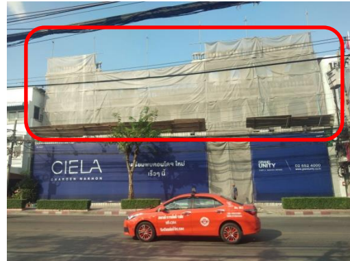
รูปที่ 5 ผ้าใบ (Mesh Sheet) คลุมตัวอาคาร