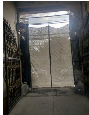
รูปที่ 2 ผ้าใบกันทางเข้า-ออกของโครงการ