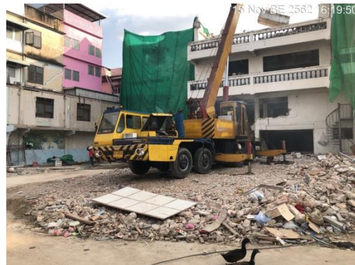
รูปที่ 9 การลำเลียงวัสดุรื้อถอนโดยใช้เครนในการขนย้าย