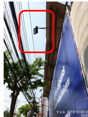
รูปที่ 7 ไฟฟ้าส่องสว่างรอบโครงการ