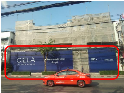
รูปที่ 6 รั้ว Metal Sheet สูง 6 เมตร