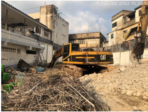
รูปที่ 10 รถ Backhoe