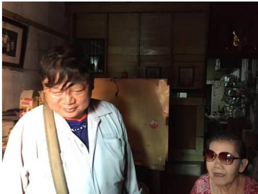
รูปที่ 8 เจ้าหน้าที่โครงการพบกับชุมชนหรือบ้านพักอาศัยข้างเคียง