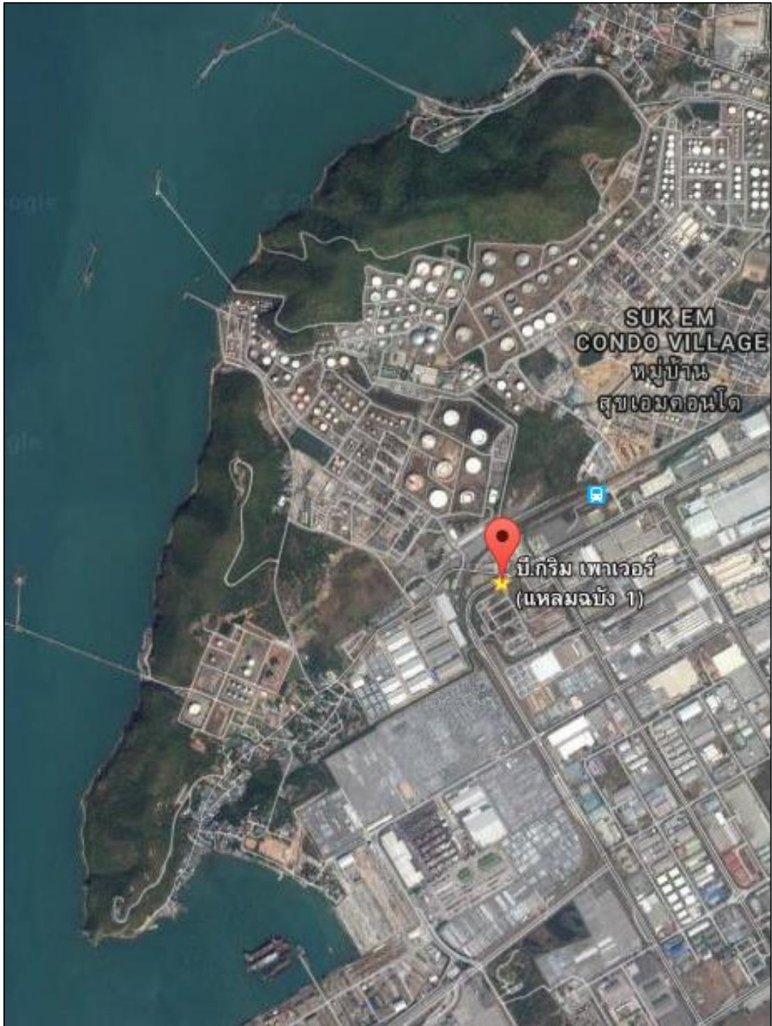
ภาพที่ 1.1 แผนที่แสดงที่ตั้งโครงการ