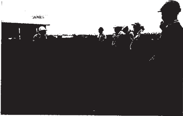
อธิบายให้ผู้สังเกตการณ์รับทราบแผนต่าง ๆ