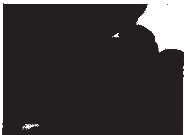
สรุปเวลาที่ใช้ในการเข้าระงับเหตุจนกระทั่งเหตุการณ์สงบลง