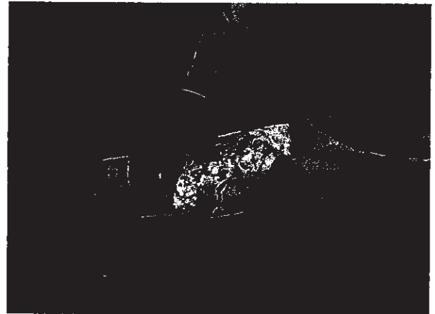
การปฐมพยาบาล