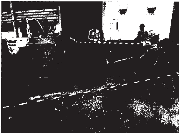
ทำการจำกัดการรั่วไหลให้แคบลงและดูดซับด้วยทราย