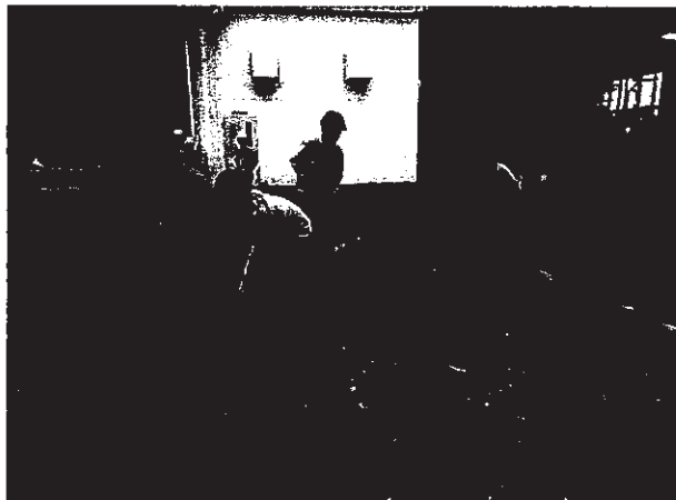
เก็บอลูมิเนียมที่เย็นตัวแล้วนำไปใส่ในภาชนะที่เตรียมไว้