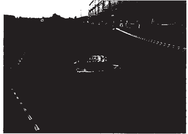
ผู้พบเห็นเหตุการณ์ทำการกั้นพื้นที่ด้วยเทปขาว - แดง