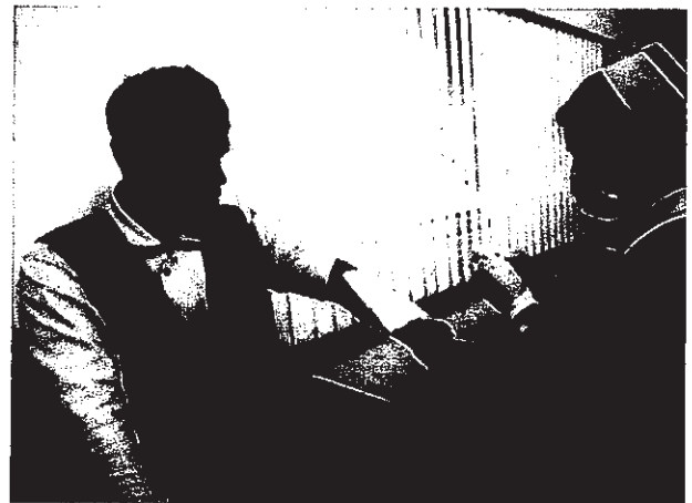
การปฐมพยาบาล