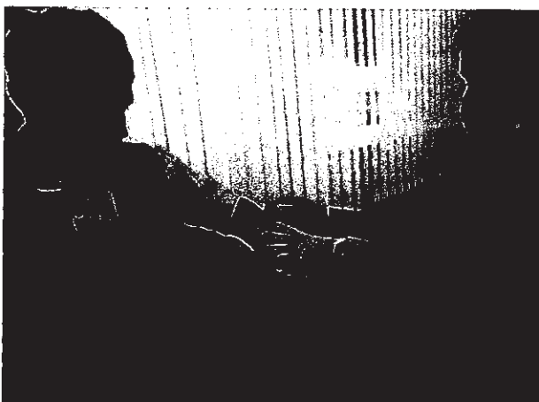
การปฐมพยาบาล