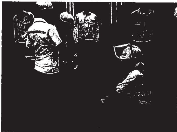
การปฐมพยาบาล