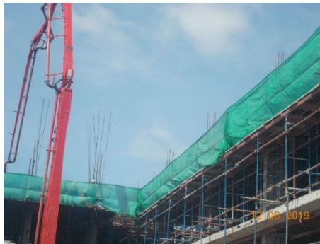
ภาพที่ 1.5-1 กิจกรรมการก่อสร้างโครงการ

สำหรับการดำเนินกิจกรรมการก่อสร้างในช่วงเดือนมกราคม-มิถุนายน 2562 พบว่ามีการดำเนินงานก่อสร้างช่วงโครงสร้างอาคาร มีความคืบหน้าของโครงการโดยรวม ณ เดือนมิถุนายน 2562 ประมาณ 50.0 % (ภาพที่ 1.5-1)