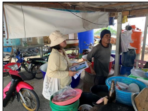
ประธานกลุ่มประมงตากวน-อ่าวประตู