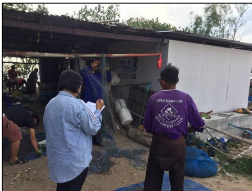
ประธานกลุ่มประมงหนองแพบ