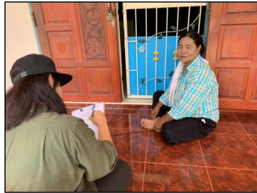
ชุมชนหนองบัวแดง