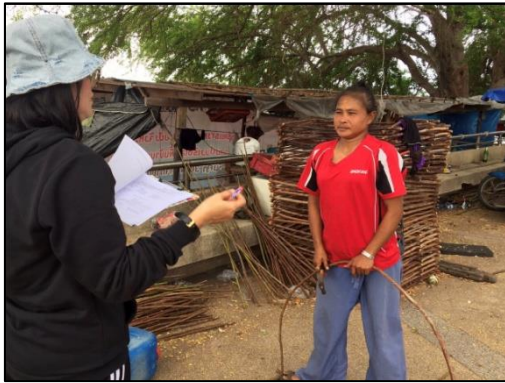
กลุ่มประมงหาดแสงเงิน