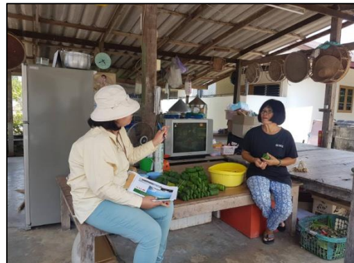
ประธานชุมชนหาดแสงเงิน