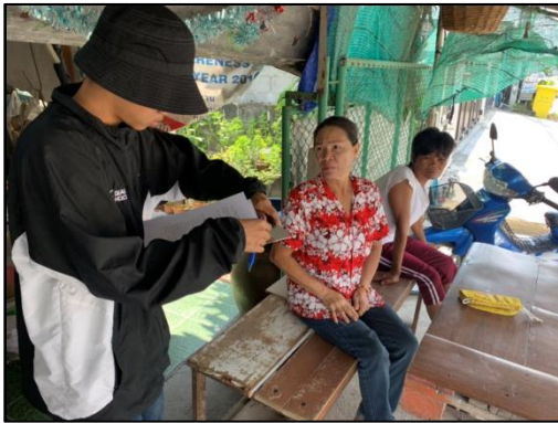
ชุมชนคลองน้ำหู