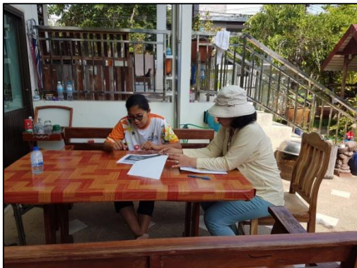
ประธานชุมชนหนองแดงเม