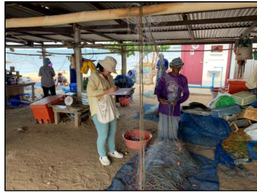
กลุ่มประมงหนองแพบ